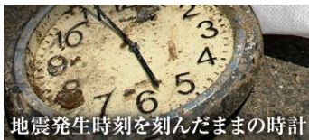
地震発生時刻を刻んだままの時計

中越大震災から 7 年が経ちます。私たちは災害からの苦難を乗り越え、復興を成し遂げ、そして多くを学びました。その地震の体験を将来に語り継ぐため、(社)中越防災安全推進機構が中心となって、中越大震災メモリアル拠点整備が進められています。独自のテーマを持つ 4 つの拠点と 3 つの公園。各施設を「中越メモリアル回廊」というネットワークで結び、各地を巡ることで「新潟県中越大震災」の多くを知ることが出来ます。ぜひお出かけ下さい。